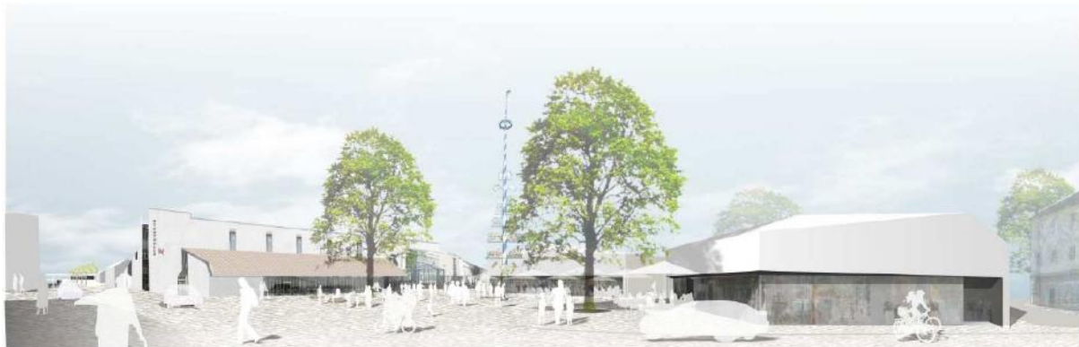
Neue Mitte Neusäß