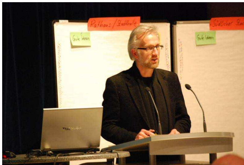
Erster Preisträger: Kehrbaum Architekten